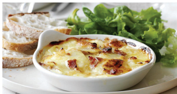
TARTIFLETTE SALAD Patate al forno con pancetta croccante e cipolle, il tutto avvolto dalla cremosita del Reblochon fuso e gratinato. 19.00