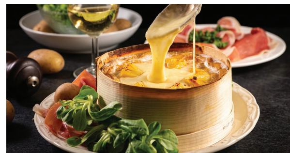
LA BOITE CHAUDE Formaggio delle Alpi fuso, servito con prosciutto crudo di Parma e patatine croccanti. 19.00