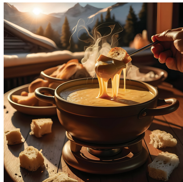
FONDUE SAVOYARDE (Minimo per due) Fonduta Savoyarda preparata con formaggi d'alpeggio fusi lentamente con crostini di pane croccanti, insalata e patatine. 25.00 per 1 pers