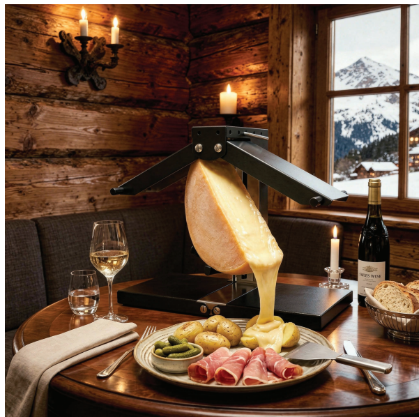
RACLETTE (La piu richiesta) (Minimo per due) formaggio Raclette, fuso al momento con tagliere di salumi, patate novelle e cetriolini croccanti. 30.00 per 1 pers